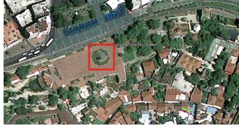
Şekil 2. Antalya Cumhuriyet Meydanı Ulusal Yükseliş Anıtı Konumu (Google Earth, 2009)

Cumhuriyet Meydanında yer alan Ulusal Yükseliş Anıtı (Şekil 2.) toplumsal ve fiziksel açıdan çevre ile ilişkileri incelenmiştir.