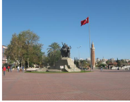
Şekil 3. Ulusal Yükseliş Anıtı (Orijinal, 2009)

Başka bir yapının bulunmadığı meydana, anıtın doğu tarafında Selçuklu Dönemi'ne ait olan Yivli Minare bakış açısına girmektedir. Meydanın çevresinde tarihsel yapı ile uyumu bulunmayan modern yapılar mevcuttur. Heykel ile mekân arasında zaman dilimi açısından uyum ya da zıtlıktan söz edilememektedir.